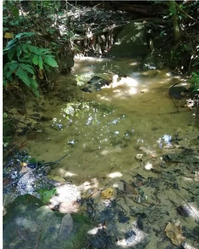
Fotografía 3. Caída de roca al predio La Palmita