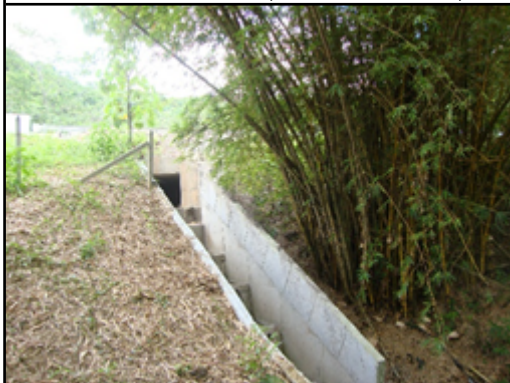
Fotografía 16 Disipador de energía por donde llegan las aguas a través de box coulvert y de los canales de escorrentía de la vía Coordenadas Planas Origen Nacional Este 4953933,261 Norte 2343120,235

Fuente: Equipo de Seguimiento Ambiental ANLA, fecha de toma de la fotografía DD/MM/AAAA