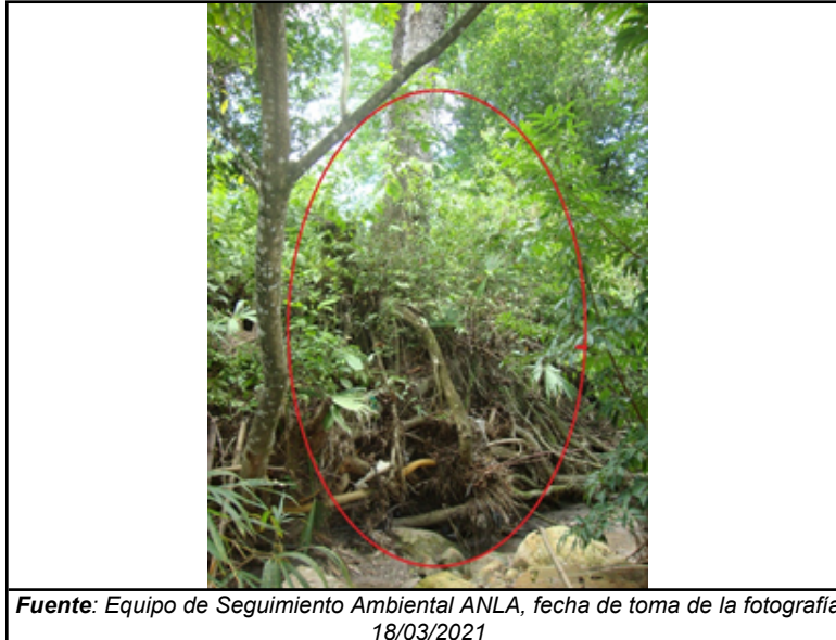
Fuente: Equipo de Seguimiento Ambiental ANLA, fecha de toma de la fotografía 18/03/2021

De esta manera de acuerdo con lo manifestado por la peticionaria, el árbol se ha venido inclinando con él a causa del aumento del caudal y de la velocidad del agua del cauce cercano a su casa, (el cual es afluente al río Sogamoso), lo cual ocurre, según ella, desde que la Concesionaria Ruta del Cacao intervino la obra hidráulica existente para la construcción de la segunda calzada de la vía.