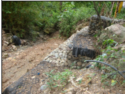
Fotografía 17 Muro de gaviones aguas arriba de la ubicación del árbol que presenta riesgo de caída Coordenadas Planas Origen Nacional Este 4953914,36 Norte 2343156,249

fecha de toma de la fotografía 18/03/2021