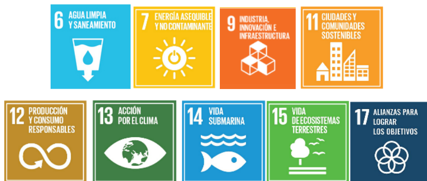
Figura 3. Objetivos de Desarrollo Sostenible relacionados con la ANLA