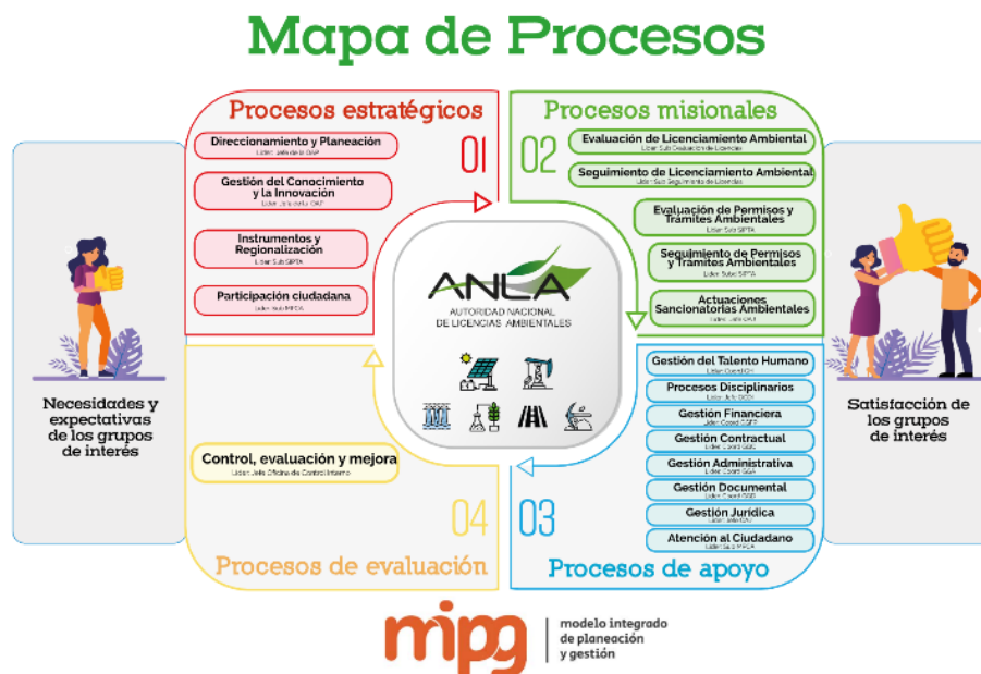
Figura 2. Mapa de procesos de la ANLA

La interrelación de los procesos mencionados anteriormente se encuentra documentada en cada caracterización, donde se describe de manera general las actividades que se ejecutan en los procesos de acuerdo con el PHVA (planear, hacer, verificar y actuar), los insumos requeridos para realizar estas actividades, los productos que se generan (los cuales son salidas que se convierten en entradas para otros procesos o para grupos de valor externos). Además, se establecen los recursos humanos, financieros, físicos y tecnológicos necesarios para el desarrollo de las actividades del proceso y contempla el Modelo Integrado de Planeación y Gestión. Las caracterizaciones se encuentran documentadas por cada uno de los procesos en el Sistema de Información Gestión de Procesos – GESPRO.