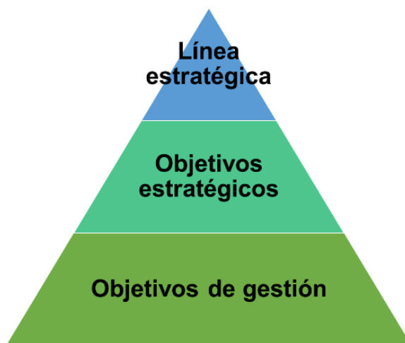
Figura 4. Estrategia jerarquizada del Plan

Se definieron cuatro (4) líneas estratégicas para el Plan Estratégico Institucional, las cuales se encuentran interrelacionadas y se proyectaron con el propósito de establecer el direccionamiento de la entidad para el cumplimiento de las apuestas de la Autoridad en el horizonte proyectado. Para el logro de dichas líneas, se establecieron objetivos estratégicos para cada una de ellas, objetivos de gestión e indicadores. A continuación, se presenta la estructura jerarquizada del plan: