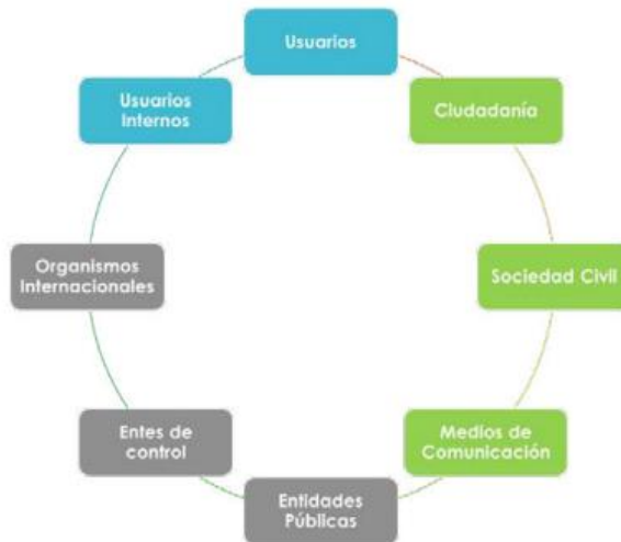
Figura 5. Grupos de valor de la ANLA

Los usuarios pueden ser personas naturales o personas jurídicas, de naturaleza pública o privada y pueden ser frecuentes, esporádicos o únicos. Los usuarios únicos son aquellos que han solicitado una sola vez algún trámite, permiso o licencia en la entidad, los cuales, de acuerdo con la revisión de la base de datos de VITAL son la mayoría. Los usuarios esporádicos son aquellos que han solicitado un trámite entre dos y cuatro veces, y, finalmente, los usuarios frecuentes, que son aquellos que han solicitado más de cinco trámites permisos o licencias ambientales.