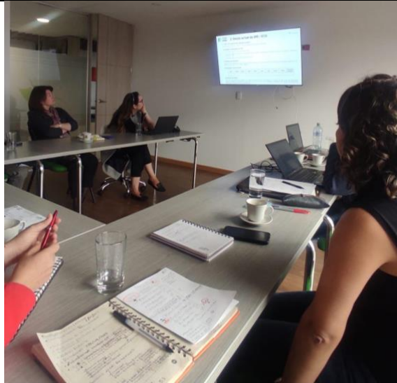
Imagen 2. Grupo de Certificaciones y Vistos Buenos desarrollando la buena práctica para la sistematización de trámites.