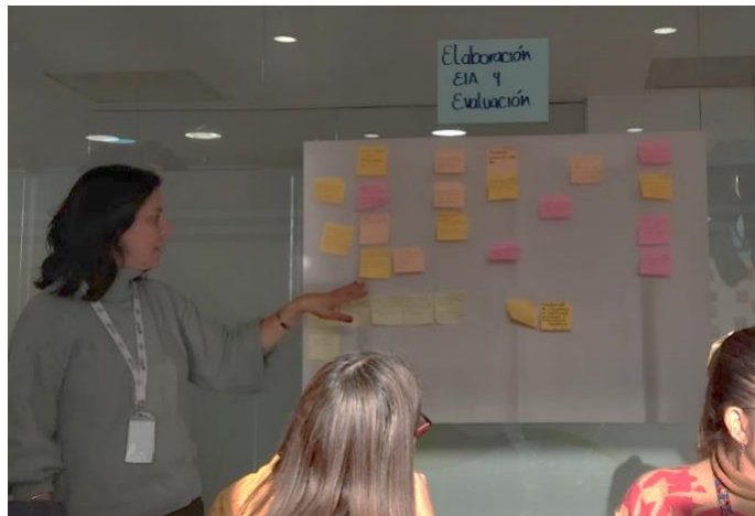
Imagen 3. Desarrollo de la buena práctica en el Grupo de Instrumentos en de la lluvia de ideas para la planeación 2024.