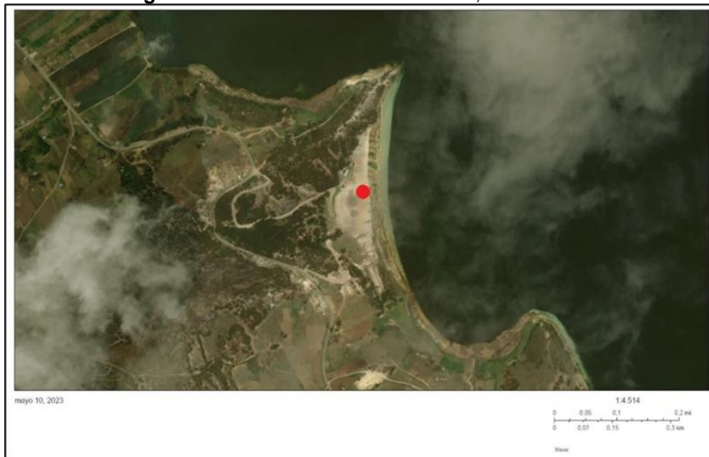
Imagen 1. Ubicación del Muelle Flotante, sistema ÁGIL.

Localización puntos de intervención para la autorización de cauce Muelle Playa Blanca.