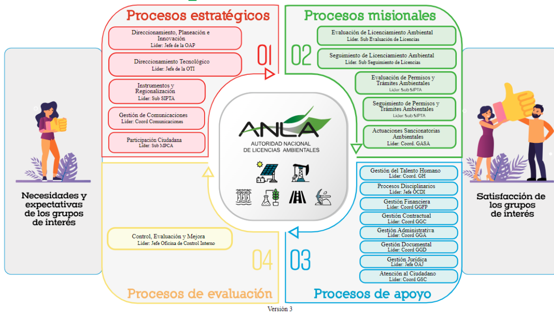
Ilustración 1 Mapa de Procesos ANLA

Teniendo en cuenta la versión No.3 del mapa de procesos, se define el nuevo proceso estratégico “Direccionamiento tecnológico”, el cual busca “Garantizar el adecuado funcionamiento, disponibilidad y usabilidad de los sistemas de información y la infraestructura tecnológica, a través de la formulación, implementación y seguimiento del Plan Estratégico de Tecnologías de la Información - PETI, en el marco del Sistema de Seguridad de la Información,