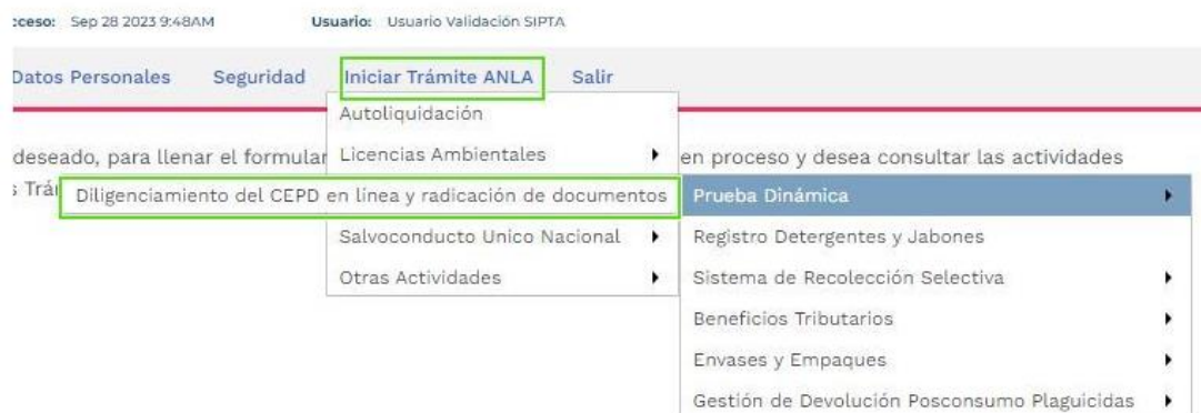
Figura 5. Inicio trámite

3. En el menú, seleccionar la opción de Iniciar Trámite ANLA, seguida de la opción Permisos Ambientales, continuar con Prueba Dinámica y por último Diligenciamiento del CEPD en línea y radicación de documentos