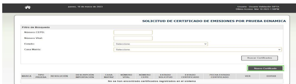
Figura 6. Selección inicio diligenciamiento formulario

4. Una vez se encuentre en el sitio de prueba dinámica pulse el botón nuevo certificado.