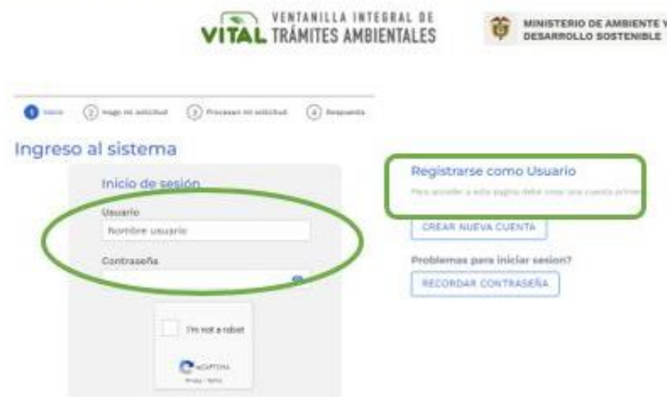
Figura 1. Registro de usuario VITAL