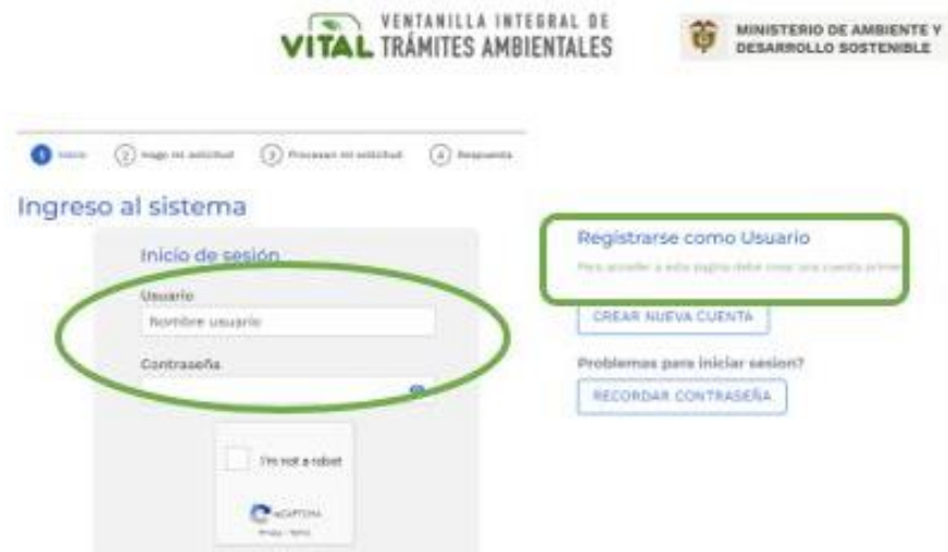
Figura 4. Ingreso - VITAL

3. En el menú, seleccionar la opción de Iniciar Trámite ANLA, seguida de la opción Permisos Ambientales, continuar con Prueba Dinámica y por último Diligenciamiento del CEPD en línea y radicación de documentos