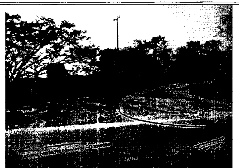
Foto 2: Cruce Coordenadas E: 847215 N: 1627823 Vía Cartagena Turbana (variante Mamonal – Gambote)