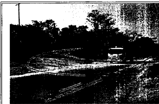
Foto 1: Cruce Coordenadas E: 847215 N: 1627823 Vía Cartagena Turbana (variante Mamonal –Gambote)

El recorrido inicia partiendo desde la ciudad de Cartagena, vía a el municipio de Turbana (variante Mamonal – Gambote), hasta el cruce en dirección al Parque Ambiental Loma de Los Cocos, aproximadamente a 25 Km, en el sector Tortugas, desde este lugar se recorren aproximadamente 200 metros, luego de los cuales, al costado izquierdo se encuentra la entrada a la Hacienda El Molino, como se muestra a continuación: