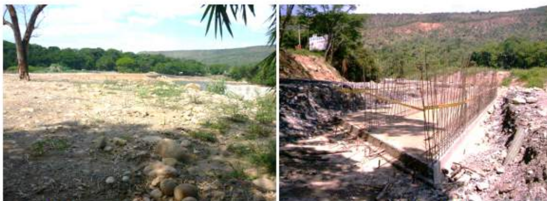
Fotos 8 y 9. Corona de tránsito de maquinaria conformada tras los gaviones y obra de arte en construcción a un extremo del gavión para dar paso a las aguas de la quebrada Golondrina. Se observa que el ancho de la obra es suficiente para permitir el desarrollo de la calzada proyectada para la glorieta, siendo de las mismas dimensiones que la corona para el tránsito de la maquinaria con la cual construyen los gaviones. (Negrilla fuera del texto original).

Posteriormente, en el Concepto Técnico 601 del 25 de abril de 2012 acogido por la Resolución 424 del 1 de junio de 2012 donde se niega la modificación de la licencia ambiental, describe lo siguiente en relación con la obra de arte: