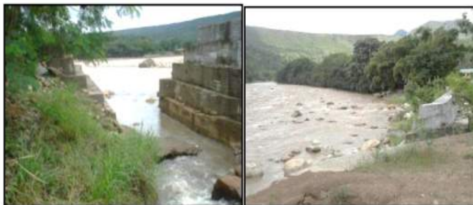
Foto 3.19. Característica de la canalización de la quebrada Golondrinas

“(…) Condición Actual: Existe un re-direccionamiento de la entrega de la quebrada Golondrinas con un canal en tierra que en su tramo final de entrega al río Sumapaz se canaliza por medio de estructuras de gaviones revestidos en ambas orillas. En la Foto 3.19 se detalla esta condición; se tiene una canalización interna de las aguas que entrega el box-culvert localizado en la vía actual a la altura del K91+340 (quebrada Golondrinas).” (Negrilla fuera del texto original)