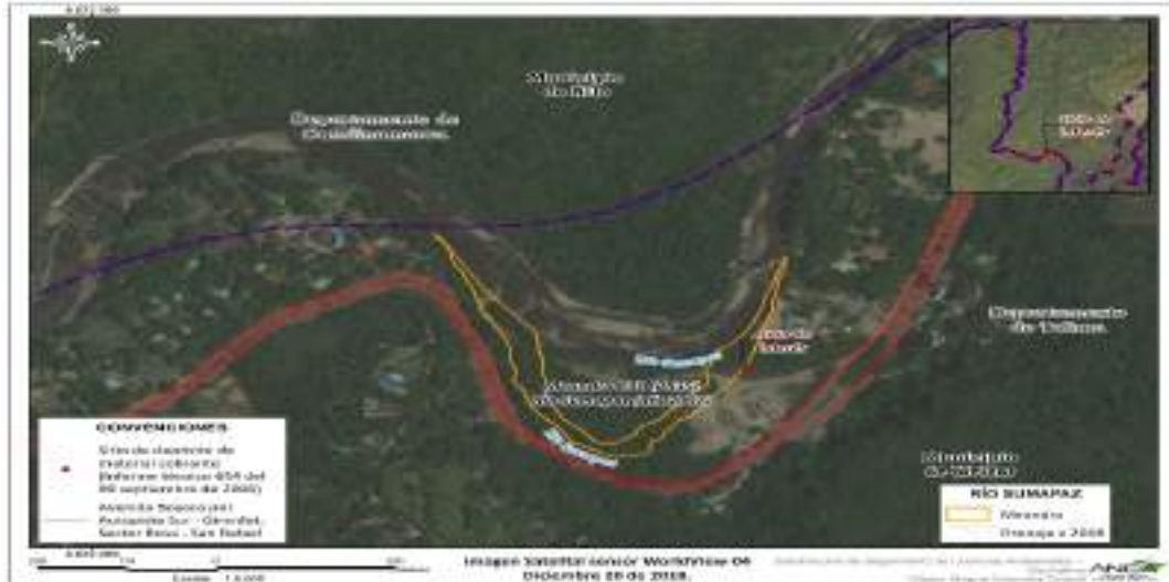
Figura 5 Área afectada al bien de protección hídrico por la modificación del meandro y acumulación de material sin compactación