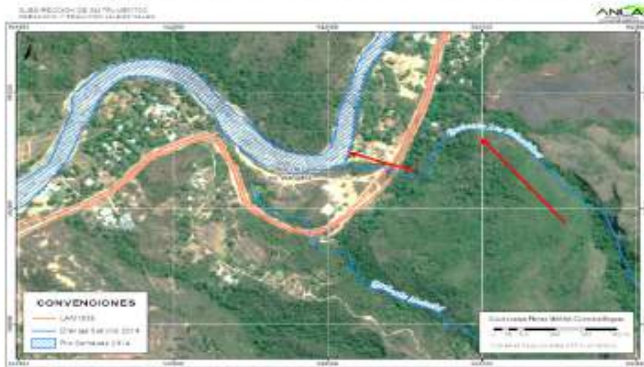
Imagen 7. Sector del K91 desviación de la quebrada Las Golondrinas. Año 2014

En la siguiente imagen se observa que para el año 2014, de manera posterior a la desaparición de la Isla de los Venados y del meandro del río Sumapaz por las obras ejecutadas con ocasión del proyecto, la quebrada Golondrinas (denominada en el cargo cuarto del Auto 1355 de 2010 como “Malachí”), fue desviada en su curso, de manera que ahora cruza la vía y sigue perpendicular a esta hasta entregar sus aguas al río Sumapaz.