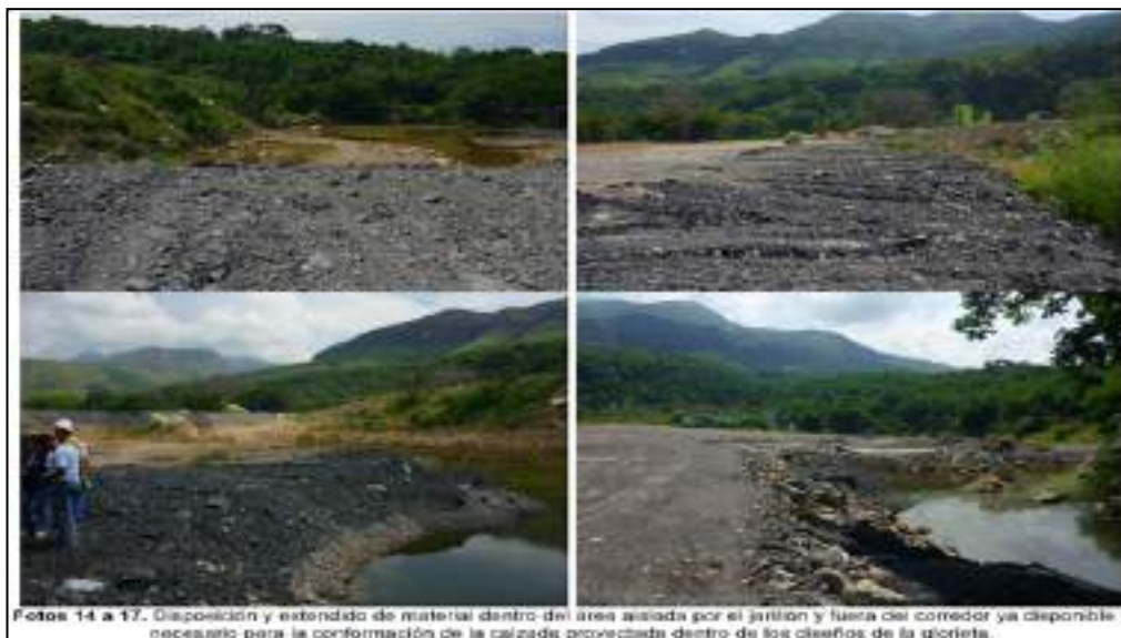
Fotos 14 a 17. Disposición y extendido de material dentro de áreas aislada por el jarillón y fuera del corredor ya disponible y necesario para la conformación de la calzada proyectada dentro de los límites de la gicrieta.

De lo anterior se puede identificar que los impactos por la acción antrópica a la zona del río que finalmente quedó aislada por causa de la construcción del jarillón y el posterior relleno y disposición del material sobrante proveniente de la excavación del Túnel del Boquerón, causó afectación al bien de protección suelo; por otra parte, para las actividades mencionadas implicaron la remoción de la cobertura vegetal y la capa superior del suelo que le daba estabilidad y cohesión al mismo, y con ello haciéndolo más propenso a procesos erosivos de la capa superficial expuesta. Esto conlleva al aumento de sedimentos transportados por el río y su posterior depositación aguas abajo del sector con la aparición de bancos de arena en zonas de baja velocidad. Por otro lado, se perturbó el equilibrio natural en la dinámica fluvial, modificando la migración de las barras meándricas y la erodabilidad 8 (resistencia a la erosión), de las orillas del canal principal del río Sumapaz.