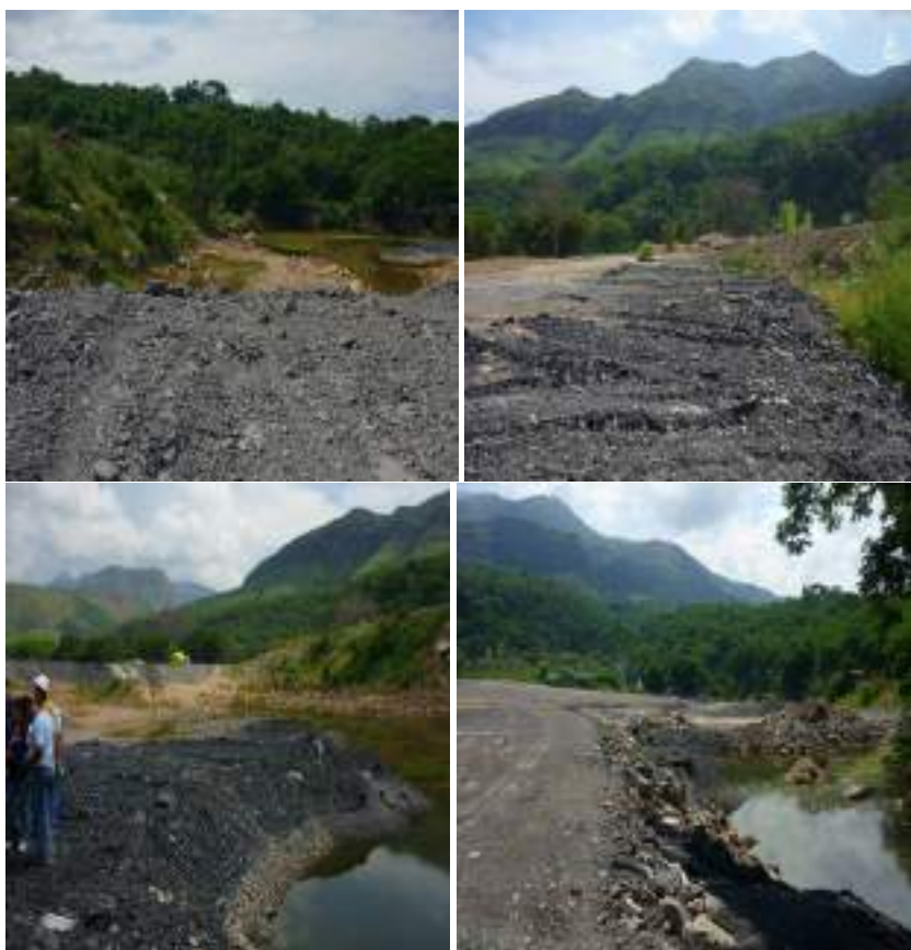
Fotos 14 a 17. Disposición y extendido de material dentro del área aislada por el jarillón y fuera del corredor ya disponible y necesario para la conformación de la calzada proyectada dentro de los diseños de la glorieta.

“Adicionalmente, se observó que la CABG está disponiendo material y rellenando el área (a manera de botadero) que quedó aislada del meandro del río con la construcción del jarillón: (Fotos 14 a 17)