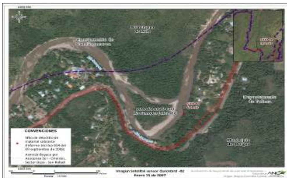
Figura 4. Punto de coordenadas Informe Técnico OPAM 654 de la Corporación Regional de Cundinamarca –CAR (Oficina Provincial del Alto Magdalena). Acumulación de material sin compactación antes del cierre del meandro.

En la zona se observa deposición de material (sobrante de la ampliación de la vía) sobre el cauce del río Sumapáz con la intención de cerrar el brazo del río acumulación de material como especie de nivelación topográfica en el área pero dicho material no se encuentra compactado y se distingue material de tipo arbóreo el cual fue talado (...)”.