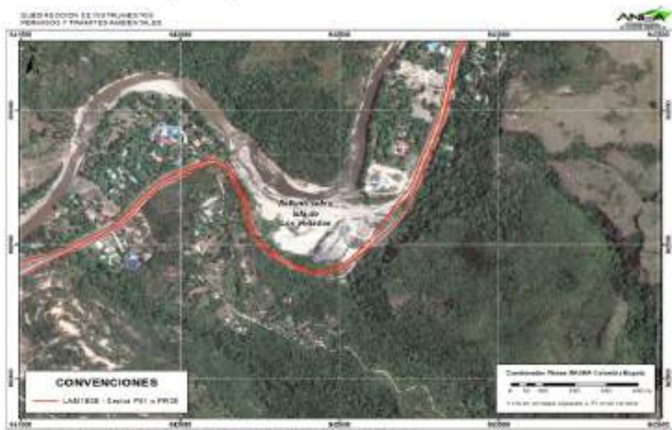
Imagen 4. Imagen sector P91 o PR35 Isla de los Venados año 2011.