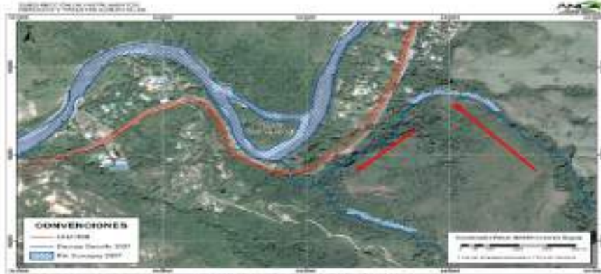
Imagen 6. Sector del K91 flujo quebrada las Golondrinas antes de las obras de doble calzada. Año 2007

“Así las cosas, con el fin de evidenciar cuál fue la quebrada que se desvió y cuál quebrada se represó, a continuación, se presenta de manera gráfica en la primera imagen la quebrada Golondrinas (denominada en el cargo cuarto del Auto 1355 de 2010 como “Malachí”), la cual fluía de manera paralela a la vía hasta confluir con la quebrada Malachi y entregar de manera conjunta sus aguas al meandro del río Sumapaz.