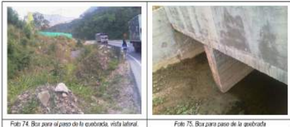
Foto 74. Box para el paso de la quebrada, vista lateral.

“También, por observación directa, se encontró que de la planta de triturado existente sobre el terreno conformado cuando la primera desviación de la quebrada Malachí, (luego de ser separada de la Golondrinas, tuvo un nuevo encausamiento artificial, quedando actualmente su desembocadura aguas arriba de la isla de los Venados), material de lodo es arrastrado por las lluvias taponando la quebrada Golondrinas, en el trayecto correspondiente entre el box que permite su paso bajo la vía y su bocana.