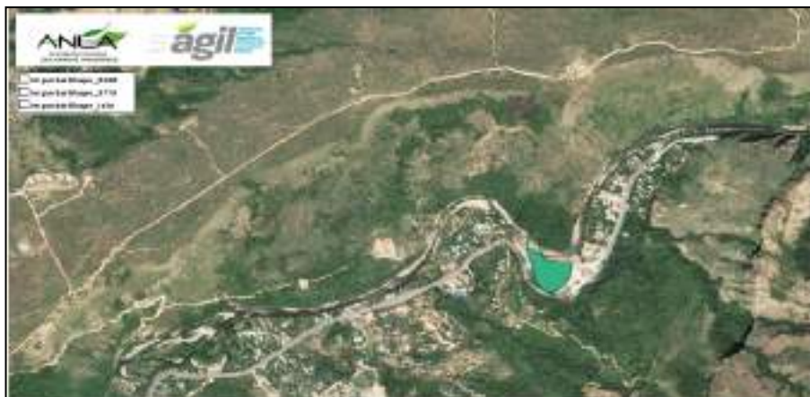
Figura 2 Extensión de la isla de los Venados - K91 o PR35.