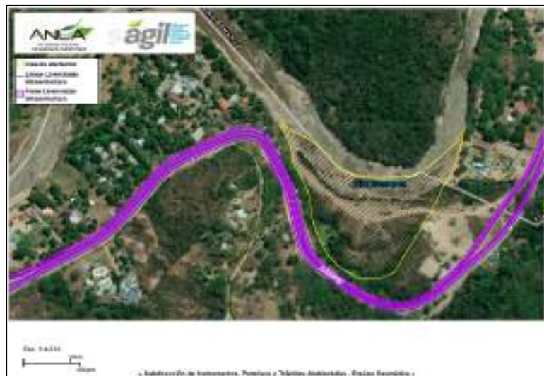
Figura 1 Área afectada por la modificación del meandro del río Sumapaz – K91 o PR35.

Con el objeto de determinar el área donde se materializaron los impactos derivados de las actividades de ocupación del cauce del río Sumapaz (a través de las cuales se generaron efectos de significancia que propendieron la alteración de las condiciones hidráulicas y morfológicas del cauce, así como en la dinámica natural del flujo del cuerpo de agua) se realizó la revisión preliminar de las imágenes satelitales disponibles en la herramienta AGIL-SAT de la Autoridad Nacional de Licencias Ambientales-ANLA, para los años 2007 y 2011, identificando que el área afectada por la construcción de las obras que no se encontraban autorizadas en la licencia ambiental correspondía a 6.5 hectáreas como se muestra en la siguiente figura: