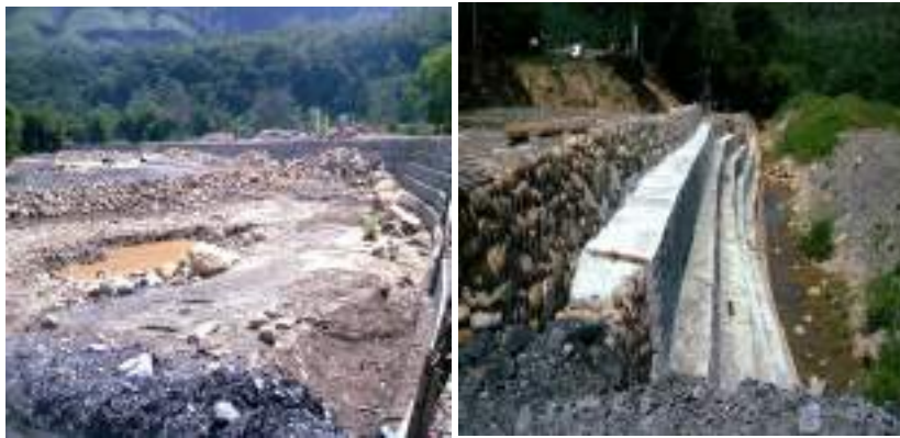
Fotos 6 y 7. Gaviones construidos para cerrar el meandro del río Sumapaz

“(…) Se observó la construcción de los gaviones cerrando el meandro del río Sumapaz (Fotos 6 y 7). Tras los gaviones se observó la adecuación del terraplén en un ancho suficiente para la conformación de la calzada contemplada para la construcción de la glorieta. En el extremo hacia Melgar del meandro, se interrumpe la construcción de los gaviones, para dar paso a la construcción de una obra de arte que permita la evacuación de las aguas de la quebrada La Golondrina, que se encontraban represadas por las obras en desarrollo. (Fotos 10 y 11)