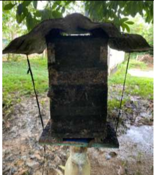
Fotografía 2. Caja racional de abejas (Cara posterior).