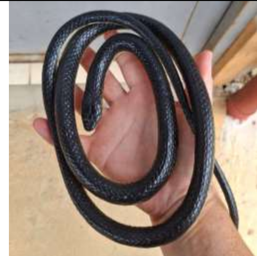
Fotografía 4. Replica de una serpiente.