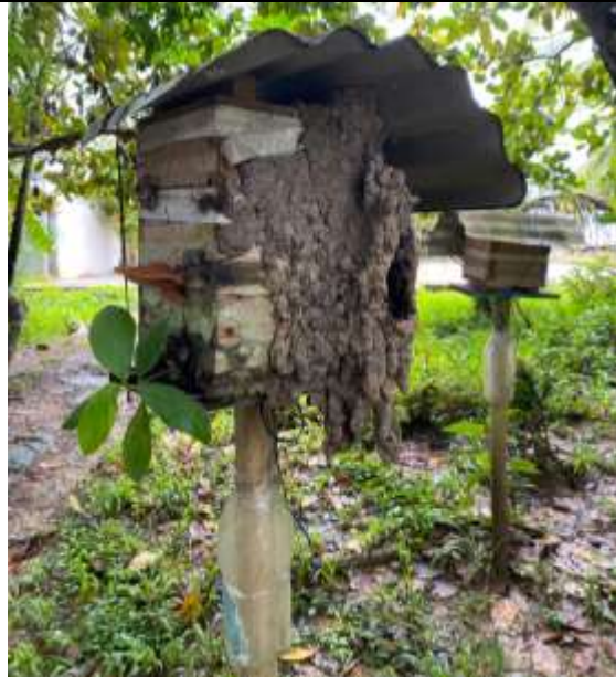
Fotografía 1. Caja racional de abejas (Cara frontal).