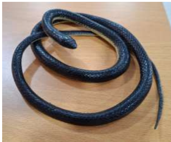
Fotografía 3. Replica de una serpiente.