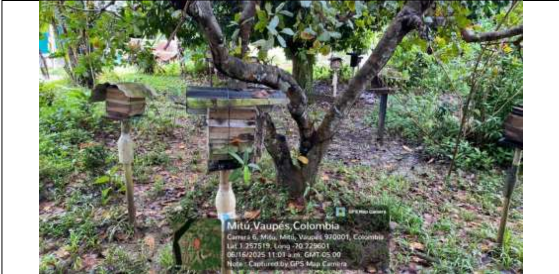
Fotografía 5. Zona de ubicación de las cajas racionales.