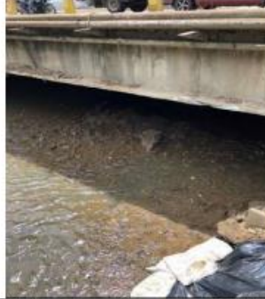
Fotografía 4. Escombros, materiales de construcción y sedimentos sobre el cauce del río.

Fuente: Visita técnica de Seguimiento Ambiental ANLA, 16/7/2019.