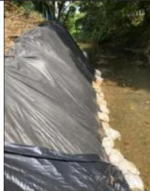
Fotografía 6. Fondo del río Lili con presenciade sedimentos.